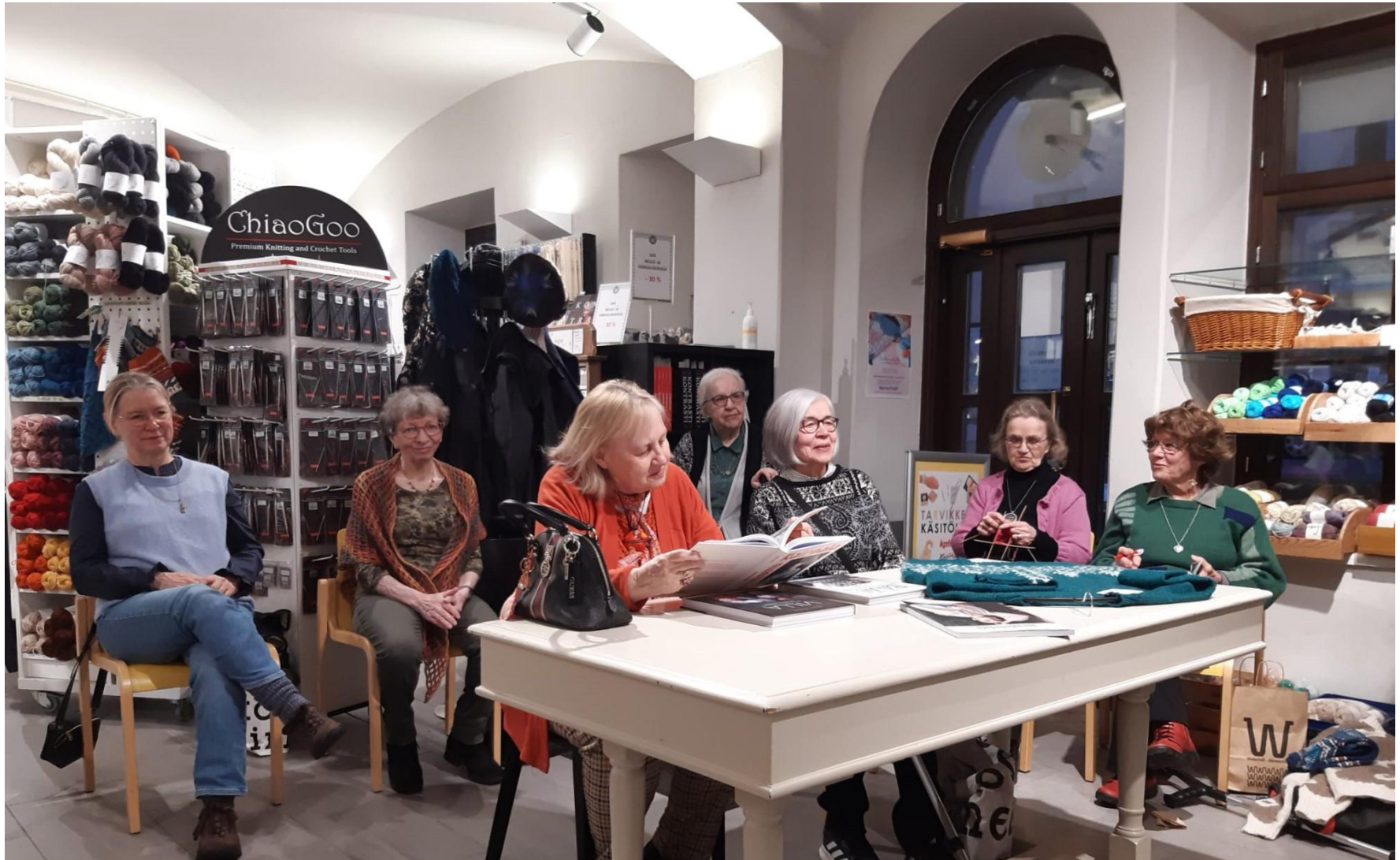
Tutussa ryhmässä leppoisasti, iloisesti, turvallisesti neuleitten pehmoisessa maailmassa