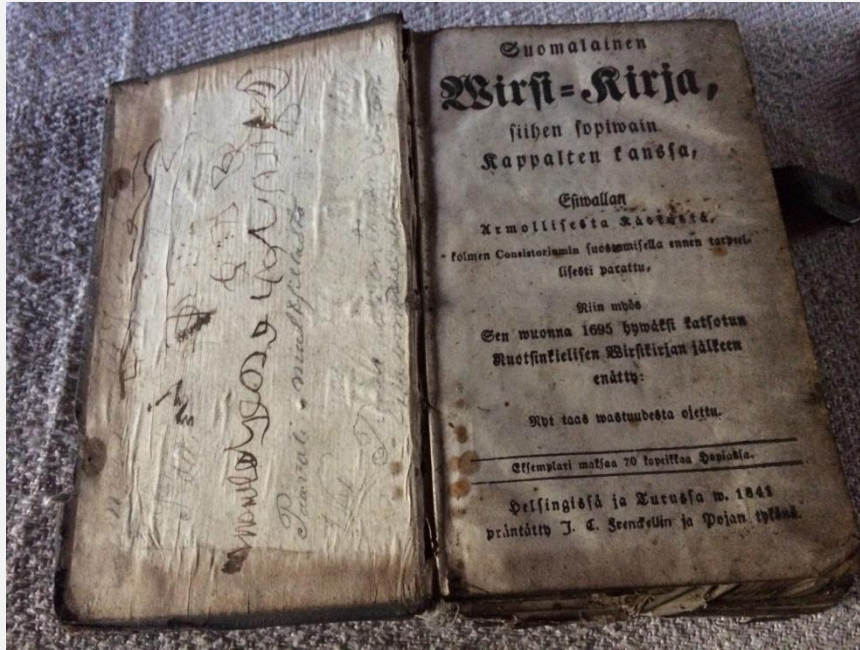
Pöydällä oli vanhoja raamattuja ja virsikirja vuodelta 1841.